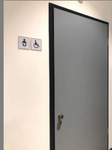
Getrennte WC Einheiten