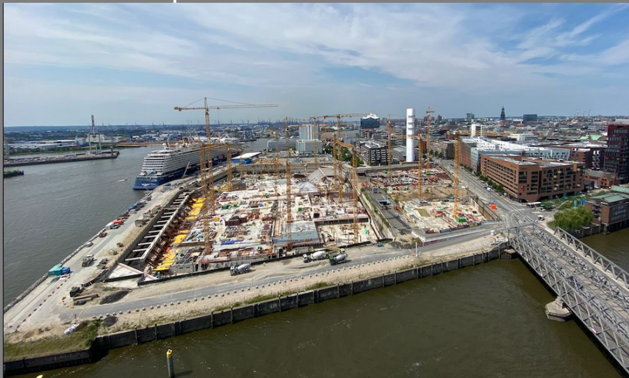
U4, Schifffahrtsterminal, Shoppingcenter als Nachbarn